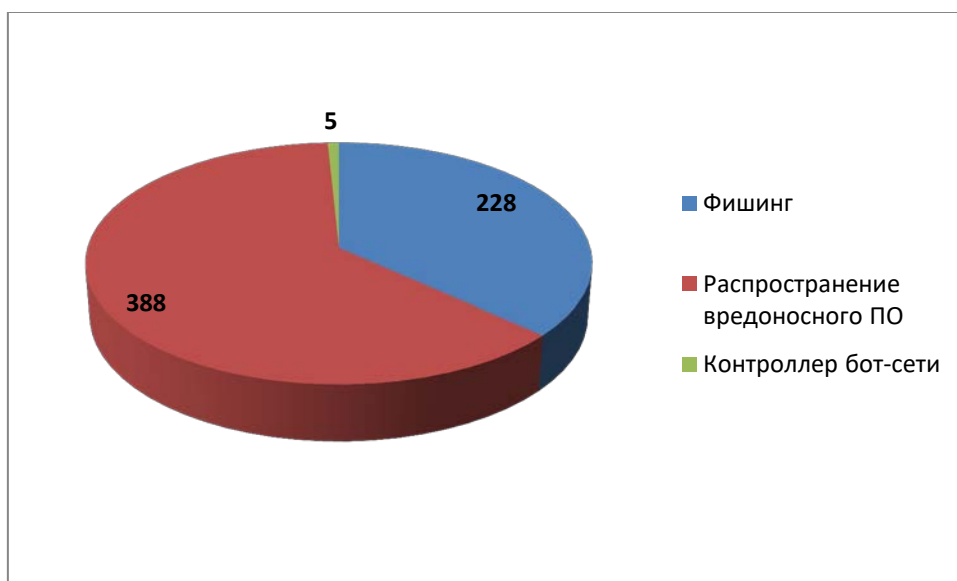
Рис.2 Распределение доменов по видам вредоносной активности (июль 2017)

Анализ доменов-нарушителей по типу выявленной вредоносной активности в отчетном периоде показал, что лидирующее место принадлежит доменным именам, связанным с распространением вредоносного программного обеспечения (388 обращений). Далее следуют фишинговые ресурсы (228 обращений) и контроллеры бот-сетей (5 обращений).